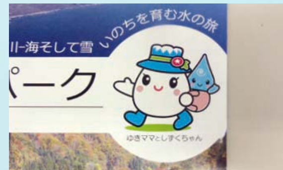
[チラシ・パンフなど印刷物]

どこに、どのような大きさ・色で使うのかを明記してください。(シール・ラベル等を商品に貼り付ける場合は、シール等のデザイン案とシールを貼る商品の画像を付けてください。)